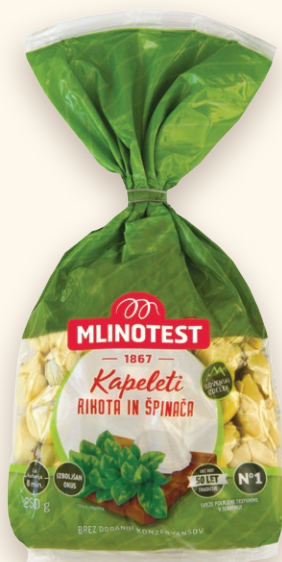
Kapeleti rikota in špinaca