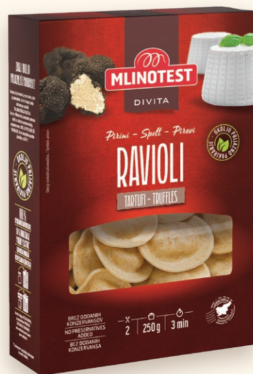
Divita pirini ravioli s tartufi