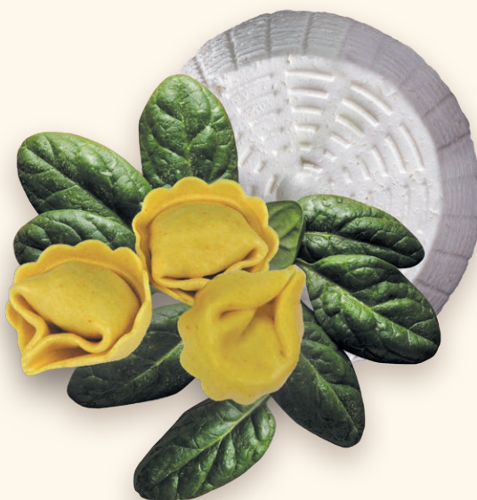
Kapeleti rikota in špinata