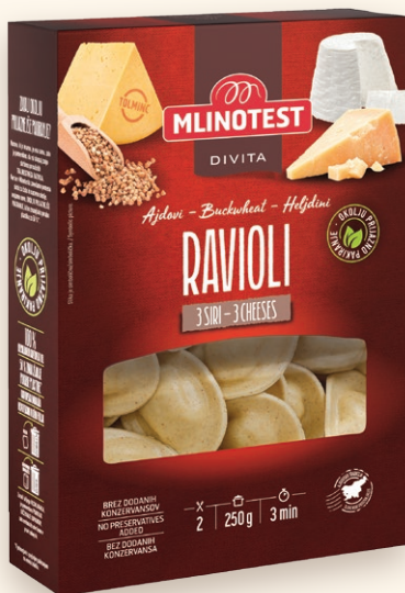
Divita ajdovi ravioli trije siri