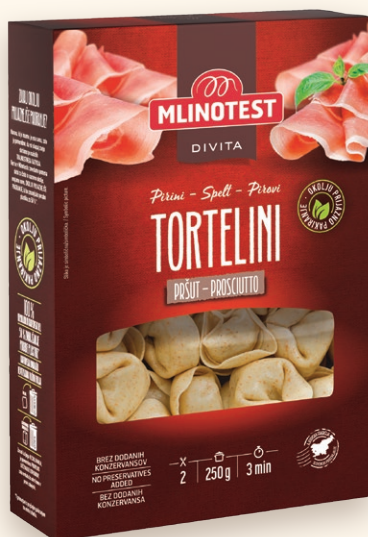
Divita pirini s pršutom