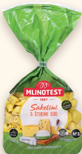
Saketini s štirimi siri