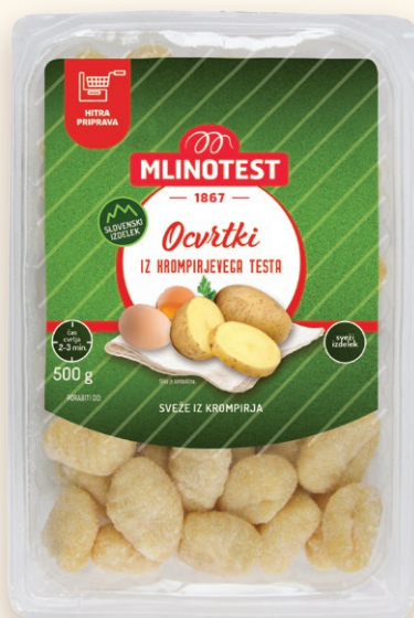
Ocvrtki iz krompirjevega testa

Ocvrtki so tako kot tradicionalni njoki pripravljene iz krompirjevega testa, skrbno izbrane moke in drugih sestavin. Njihov poln okus in hrustljivost bosta razveselila tako majhne kot velike.