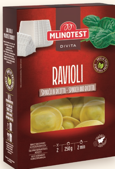
Divita ravioli špināča in ricotta