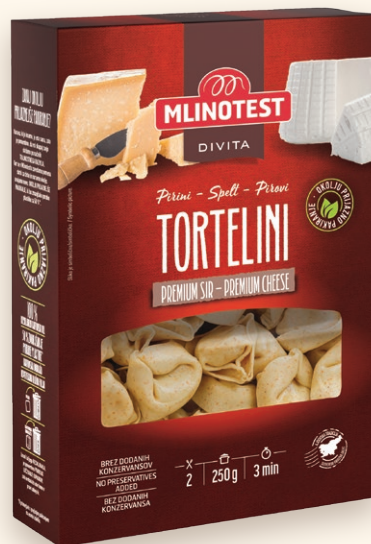
Divita pirini tortellini premium sir