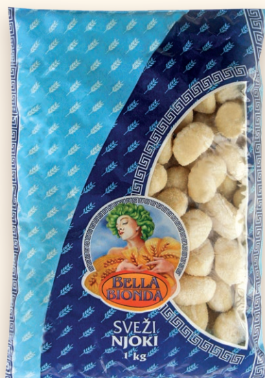
Bella bionda rebrasti sveži njoki

Rebrasti krompirjevi njoki so blazinice rebraste oblike in rahlo hrapave površine ter značilnega vonja ter okusa po domačih krompirjevih njokih.