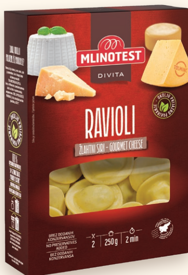
Divita ravioli žlahtni siri